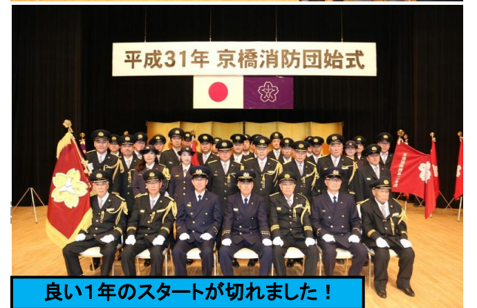
良い1年のスタートが切れました！